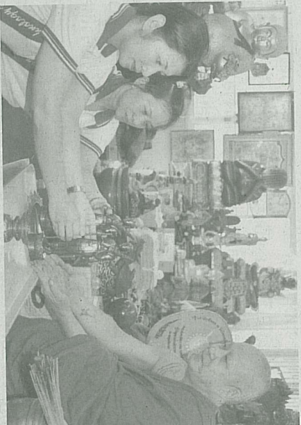
ก่อนญาติโยมร่วมวัดอุดมคณ หลวงพ่อพิเชฐอธิษฐานจิตอีกครั้ง