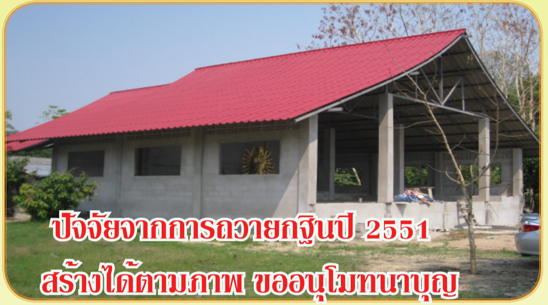
ปัจจัยจากการถวายกฐินปี 2551 สร้างได้ตามภาพ ขออนุโมทนาบุญ

ด้วยสำนักสงฆ์มะค่างามอาศรมสุขาวดี มีความประสงค์ที่จะก่อสร้างศาลาปฏิบัติธรรมที่ยังค้างอยู่ให้สำเร็จลุล่วง เพื่อประโยชน์ในการปฏิบัติศาสนกิจ และส่งเสริมพระศาสนาโดยต้องใช้งบประมาณอีกจำนวนมาก ดังนั้นคณะกรรมการจึงมีความประสงค์ที่จะขอเชิญพุทธศาสนิกชนทุกท่าน ร่วมเป็นเจ้าภาพ ถวายกฐินสามัคคี พร้อมทั้งจำนำบริวารกฐิน ปี 2552 เพื่อสนับสนุนสร้างเสนาสนะสงฆ์ไว้ในวาระพระศาสนา เพื่อจะได้สืบทอดพระศาสนาต่อไป ขออำนาจคุณพระศรีรัตนตรัยและสิ่งศักดิ์สิทธิ์ทั้งหลายทั่วสากลโลก อาณัติคุณงามความดีที่ท่านปฏิบัติมาโดยตลอด และผลของการทอดกฐินและจำนำบริวารนี้ งดดอบันดานประทุพพโรหิตท่านและครอบครัว ญาติมิตรมีความสุข ความเจริญ ในสิ่งที่ปรารถนาทุกประการ