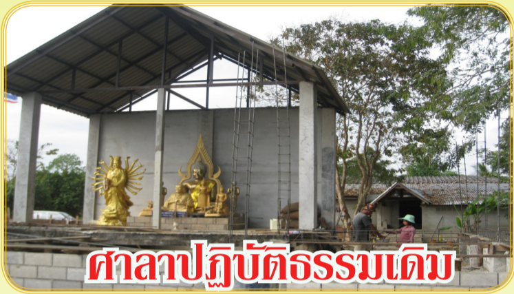
ศาลาปฏิบัติธรรมเดิม